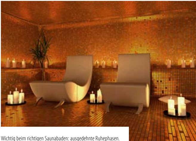
Wichtig beim richtigen Saunabaden: ausgedehnte Ruhephasen.

einreiben. „Im Liegen ist die Temperatureinwirkung am gleichmäßigsten. Um den Kreislauf auf das Verlassen der Kabine vorzubereiten, sollte man sich kurz vorher aufrecht hinsetzen“, erklärt Gensow. Im kalten Außenbereich kann die Wärme über die Schleimhautoberflächen abgegeben werden, daher ist erst einmal langsames Umhergehen angesagt. „Dann erst kommt das kalte Wasser aus dem Kneippschlauch oder der Kübeldusche an die Reihe. Wer ganz gesund ist, kann auch das Tauchbecken nutzen“, so Gensow. Erst durch die Kaltwasseranwendung setzt der berühmte Saunaeffekt ein, der das Immunsystem stärkt. Idealerweise beginnt man herzfern mit Füßen, Beinen und Rücken, fährt nach dem gleichen Prinzip mit der Vorderseite fort